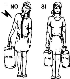
BILANCIARE SEMPRE I CARICHI