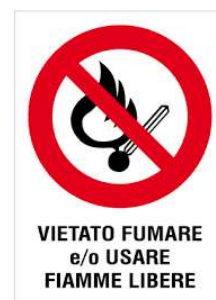
VIETATO FUMARE e/o USARE FIAMME LIBERE

L'incendio è la combustione (reazione chimica di un combustibile con un comburente in presenza di innesco) sufficientemente rapida e non controllata che può svilupparsi senza limitazioni nello spazio e nel tempo. Il rischio di incendio è sempre presente in qualsiasi attività lavorativa.